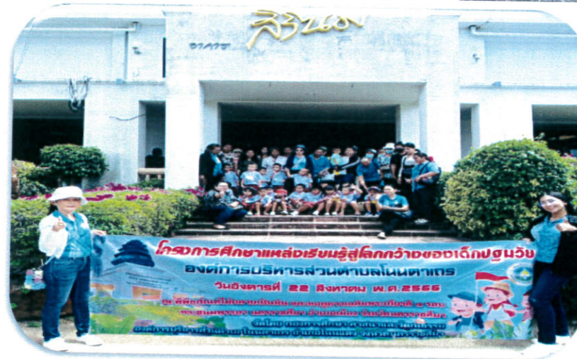
งานวิเคราะห์และงบประมาณ องค์การบริหารส่วนตำบลโนนตาเถร